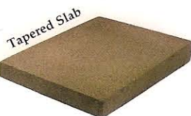
Дренаж по направлению к центральной оси